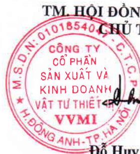
Đỗ Huy Hùng